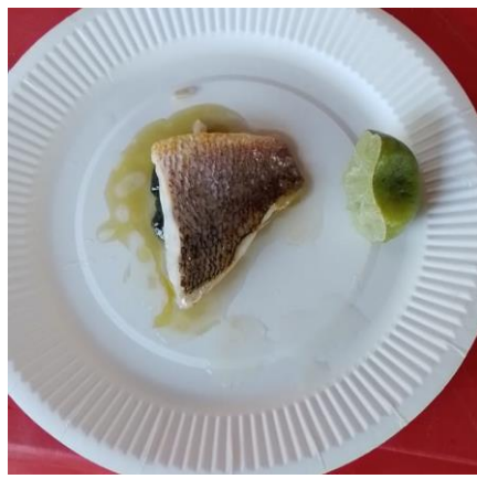
鯛のポワレ・バジルソース